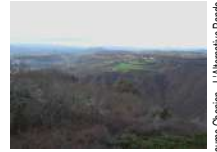
© Guillaume Chronon - L'Alternative Rando