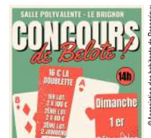
@Association des habitants de Bassarioux