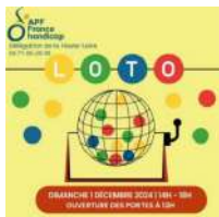
@APF France Handicap