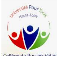
Collège du Puy-en-Velay