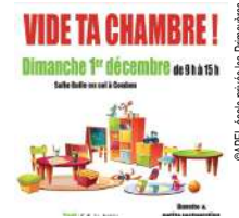
@APEL école privée Les Primevères