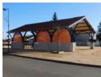
© Maire St Christophe sur Dolaison