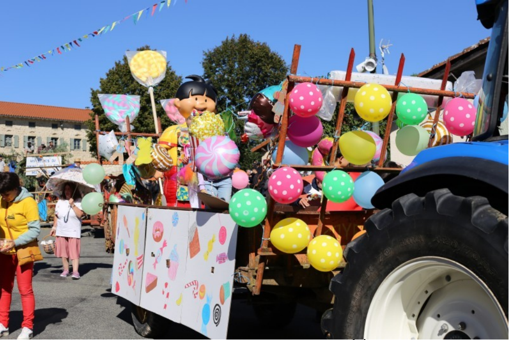
CRISE DE FOIE À ALMANCETTE