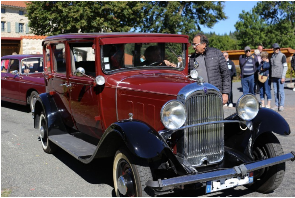
LES VOITURES ANCIENNES