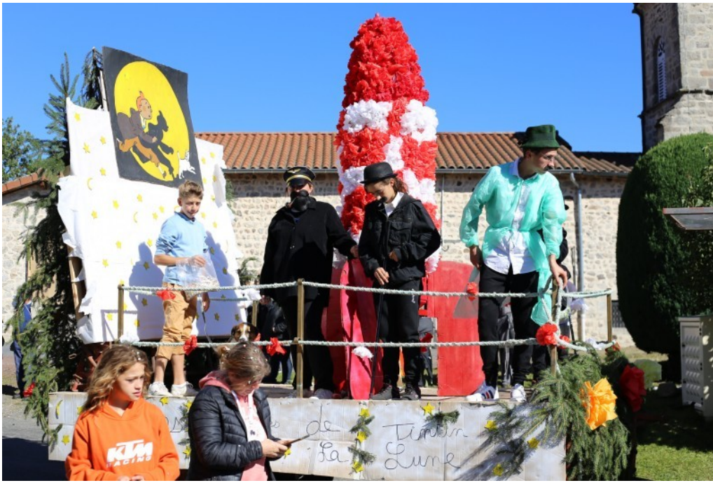
ESTABLES ET TINTIN SUR LA LUNE