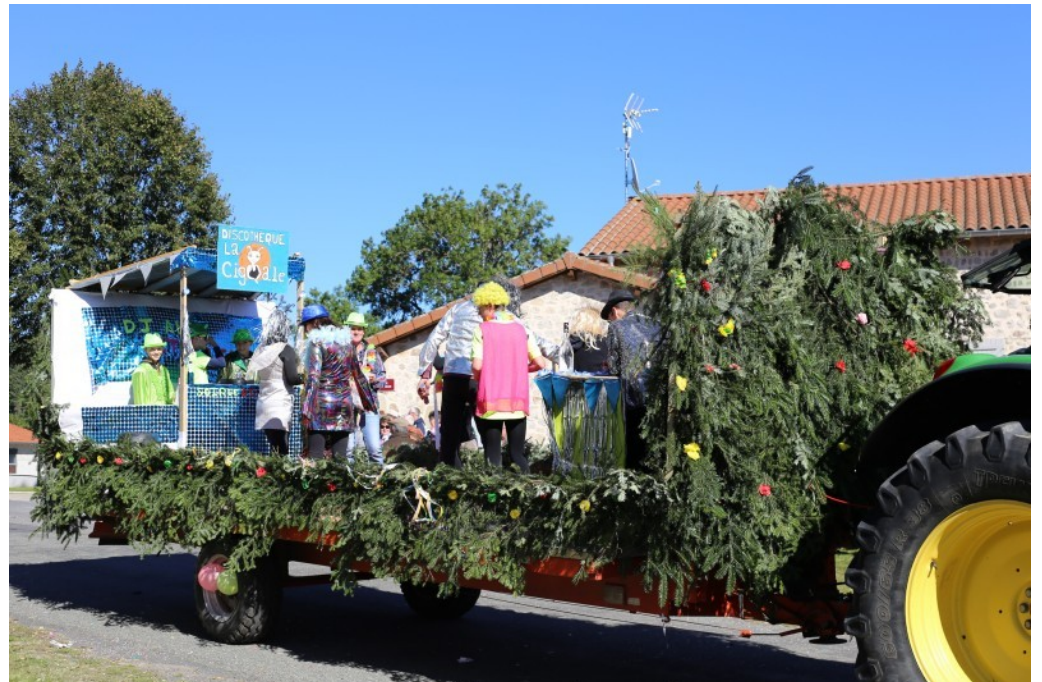
ESTABLES ET LES ANNÉES DISCO