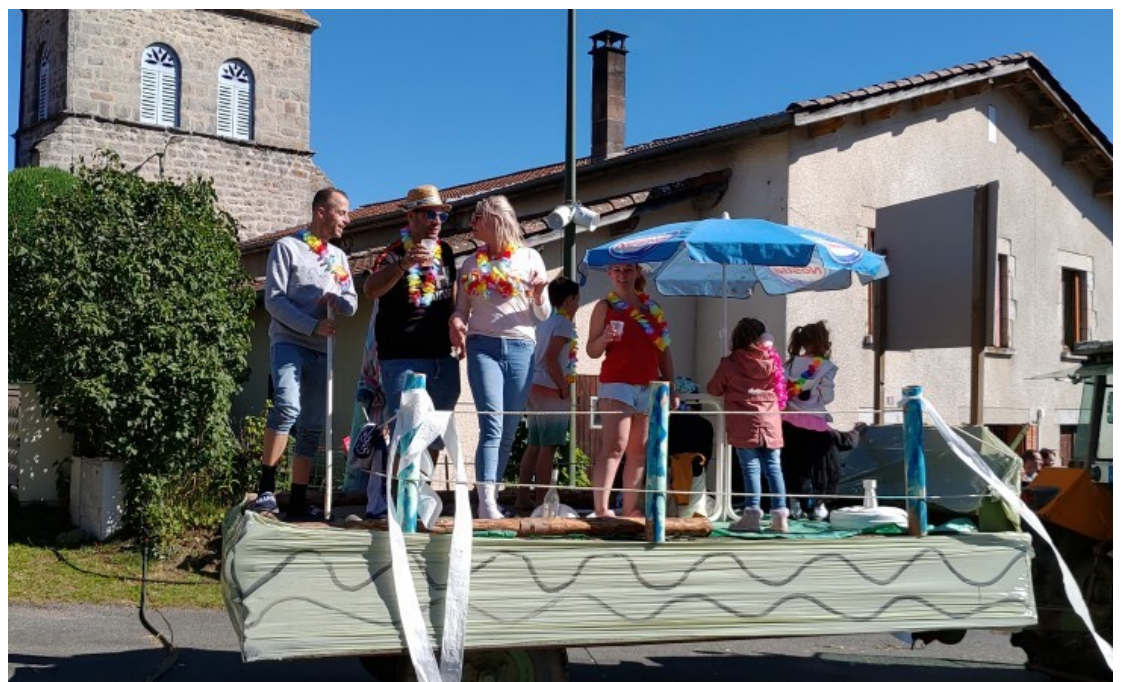
CAMPING À SEMBADEL GARE