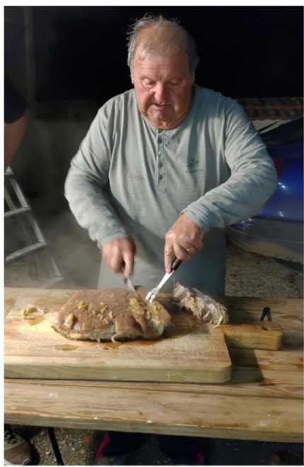
Préparation du repas "La soupe aux choux"