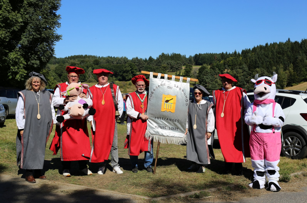
CONFRÉRIE DU SARRASSOU