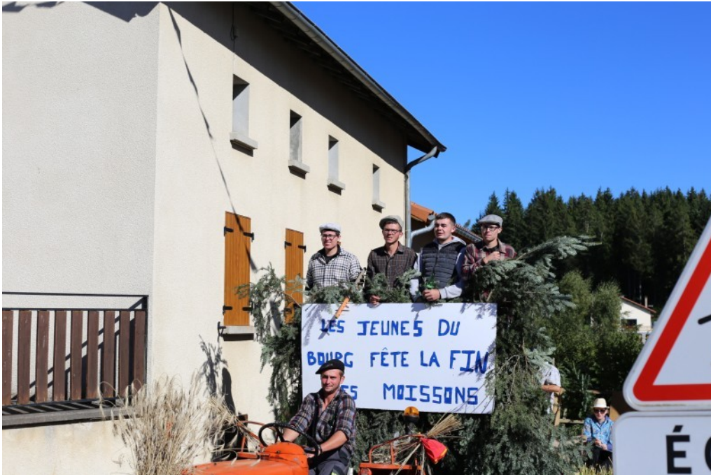
LES JEUNES DU BOURG « FÊTE » LA FIN DES MOISSONS