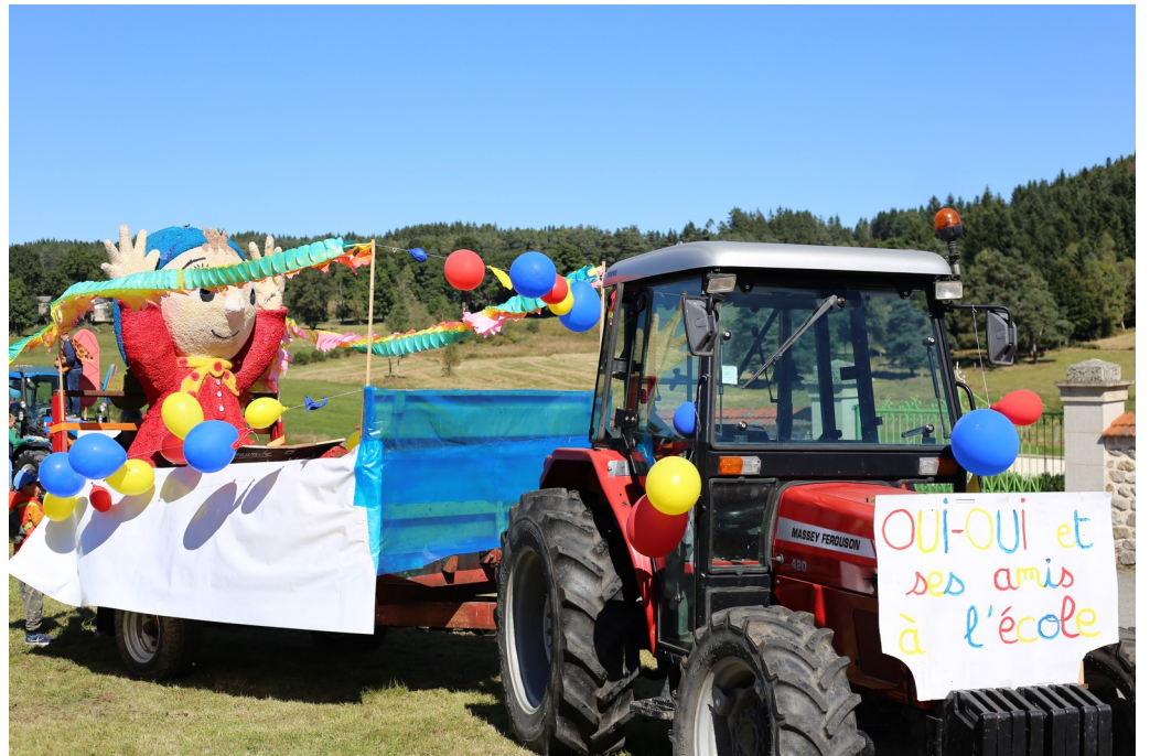
OUI-OUI ET SES AMIS À L'ÉCOLE