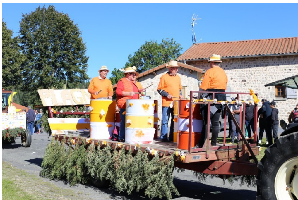
PLAGNES ET SES TAMBOURS